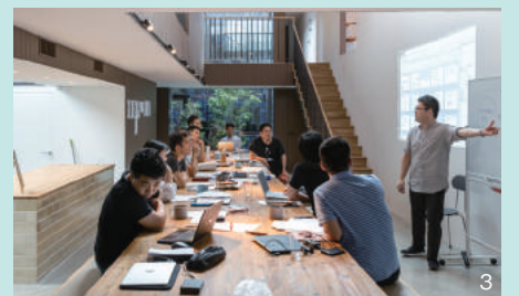
1. 外観 2. ホール 3. プログラムの様子 Photo by Yurika Kono 1,2