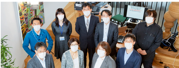
第3期生とスタッフ：Final Showcase／2021年2月、toberu 1号館