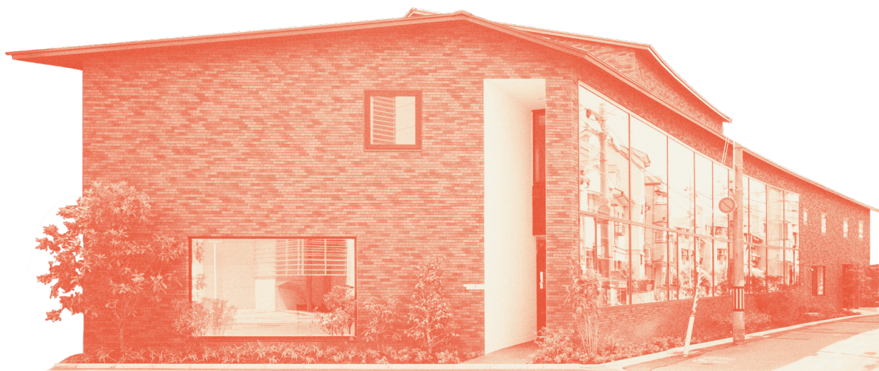
toberu 1号館 (2号館は徒歩30秒)