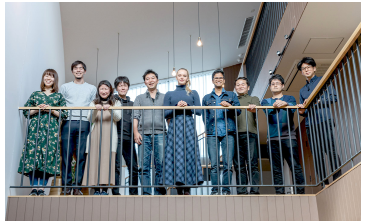
第2期生：居住最終日／2020年3月、toberu 1号館