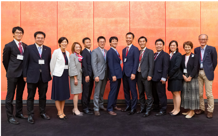
第1期生と創業メンバー：Final Showcase／2019年10月、京都大学 芝蘭会館