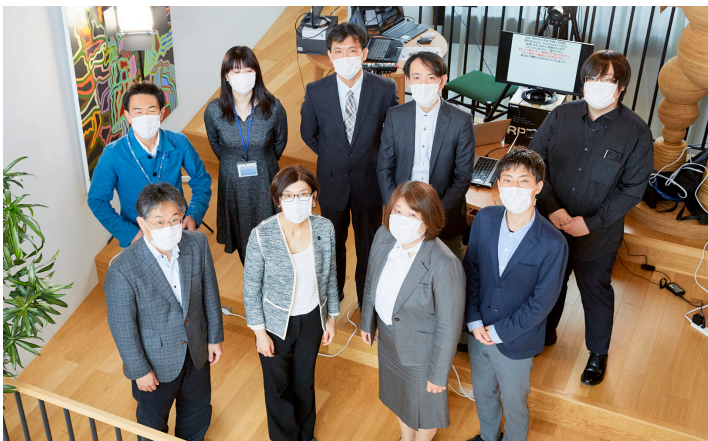
第3期生とスタッフ：Final Showcase／2021年2月、toberu 1号館