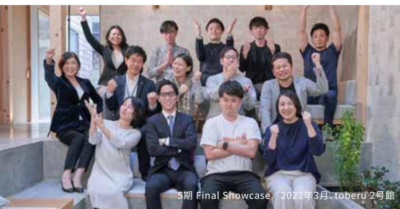
5期 Final Showcase / 2022年3月、toberu 2号館