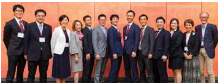
1期生と創業メンバー：Final Showcase/2019年10月、京都大学 芝蘭会館