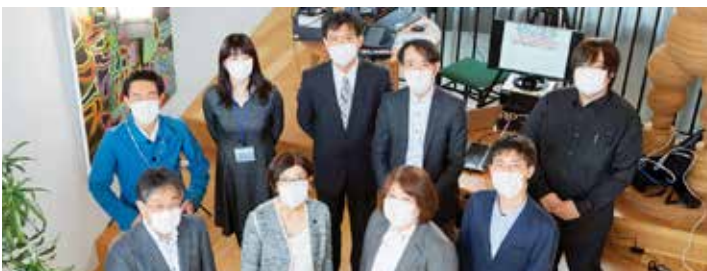
3期生とスタッフ：Final Showcase/2021年2月、toberu 1号館