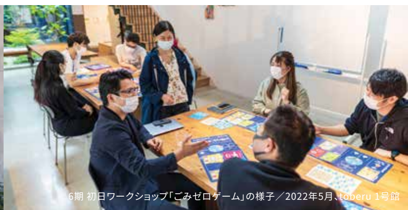
6期 初日ワークショップ「ごみゼロゲーム」の様子 / 2022年5月、toberu 1号館