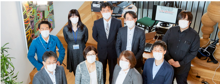
3期生とスタッフ：Final Showcase/2021年2月、toberu 1号館