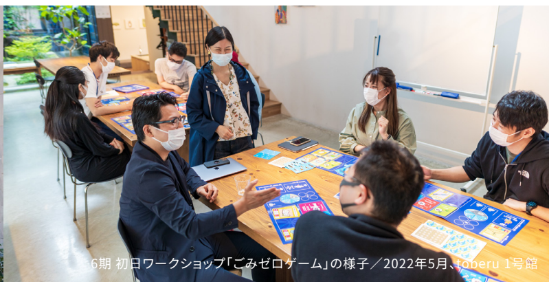
6期 初日ワークショップ「ごみゼロゲーム」の様子 / 2022年5月、toberu 1号館