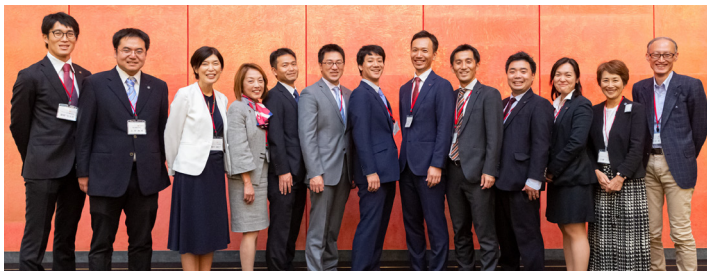
1期生と創業メンバー：Final Showcase/2019年10月、京都大学 芝蘭会館