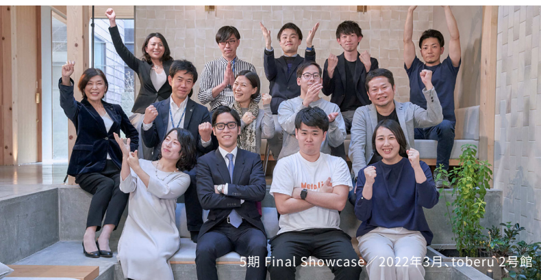
5期 Final Showcase / 2022年3月、toberu 2号館